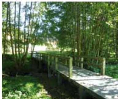
LA NATURE EN VILLE, LA VILLE JARDIN

Un lieu dans lequel il fait bon vivre, c'est aussi un lieu dans lequel l'offre de logements est suffisamment ouverte pour répondre aux besoins des habitants et favoriser ainsi la mixité sociale et générationnelle.