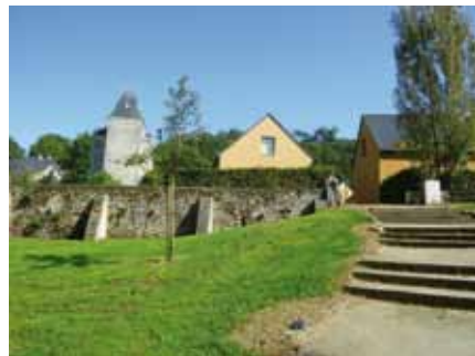
ENTRÉES ET CŒURS DE BOURGS VALORISÉS