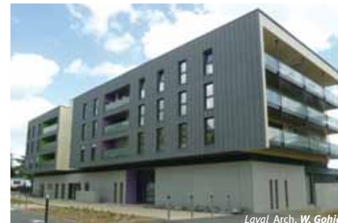
CRÈCHE ET LOGEMENTS