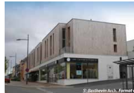
LOGEMENTS MIXTES COMMERCES DE PROXIMITÉ