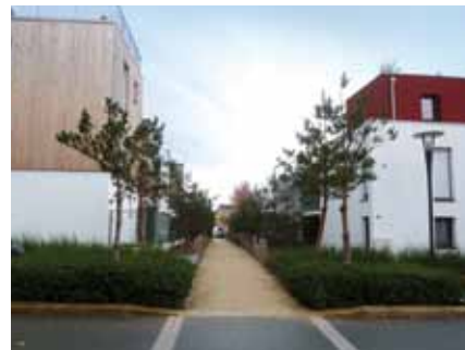
LIAISONS DOUCES HABITATS DIVERSIFIÉS